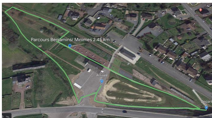
Parcours Benjamins/Minimes 3 boucles = 2.45 km