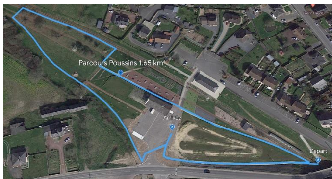
Parcours Poussins 2 boucles = 1.65 km