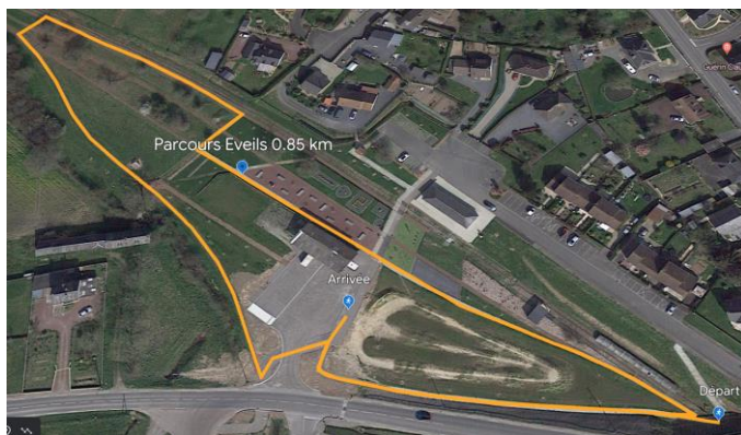
Parcours Eveils 1 boucle = 0.85 km